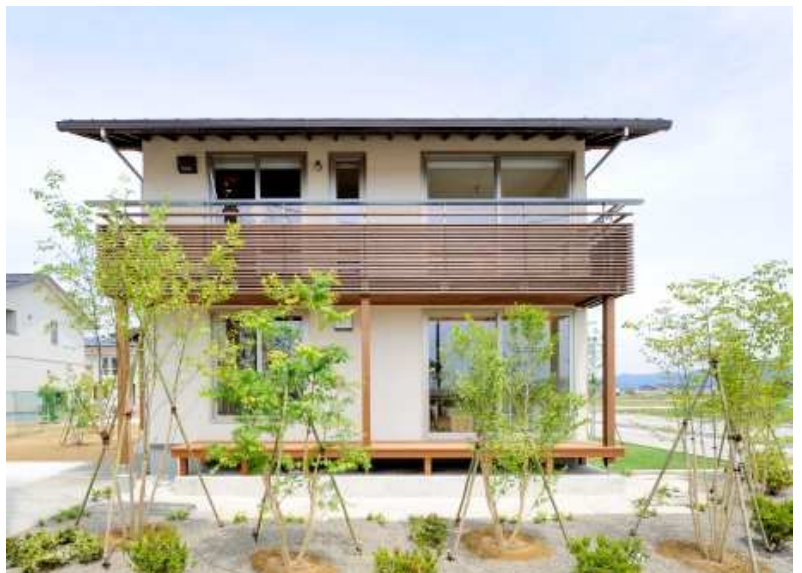
花園南モデルハウス