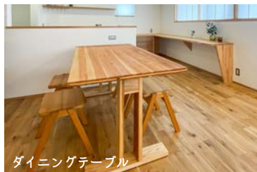
ダイニングテーブル