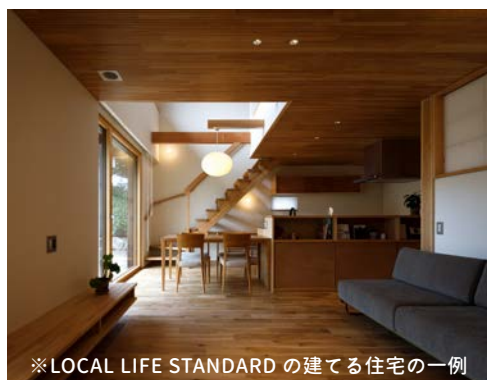
※LOCAL LIFE STANDARD の建てる住宅の一例